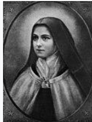
Thérèse de Lisieux