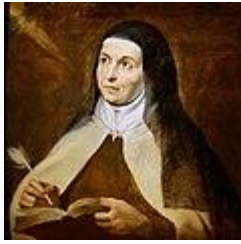
Thérèse d'Ávila par Rubens